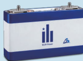
リチウムイオン電池セル(55Ah級)