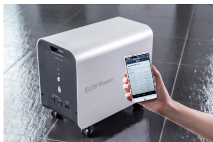
「POWER YIILE 3」

各製品情報はこちら → https://www.eliipower.co.jp/products/index.html