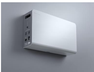
「POWER YIILE HEYA」