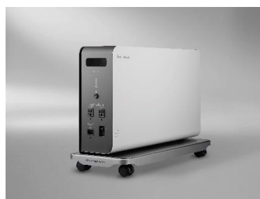
「POWER YIILE HEYA S」