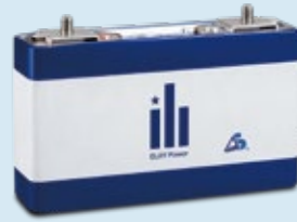
リチウムイオン電池セル(55Ah級)