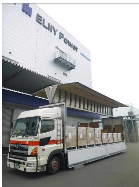
Enphase AC Battery™

エリーパワーは2006年の創業以来、安全性を最優先に技術開発及び製品開発を行ってまいりました。今後も世界のエネルギー問題、環境問題を解決するため、エネルギーを貯蔵して活用するシステムを普及させようという理念のもと、リチウムイオン電池及び蓄電システムの開発と普及に取り組んでまいります。