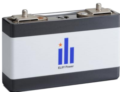
<電力貯蔵用大型リチウムイオン電池セル>